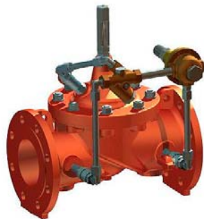
Druckreduzierer DM90 mit Pilot

Die Serie DM90 reduziert einen variablen Eingangsdruck in einen tieferen konstanten Ausgangsdruck, unabhängig von Durchfluss- und/oder Eingangsdruckänderungen.